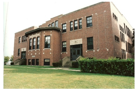
Directora: John Burkholder

Nuestra escuela apoya la visión del Distrito Escolar Metropolitano de Madison (MMSD, por sus siglas en inglés) en la cual todos los estudiantes adquieren las destrezas y habilidades necesarias para tener éxito, incluyendo un dominio en las áreas de contenido académico, mentalidad de crecimiento, autoconocimiento, creatividad, bienestar, habilidades